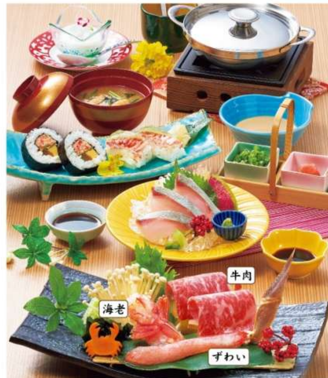
黒部 くらべ 3,200円(税込3,520円)