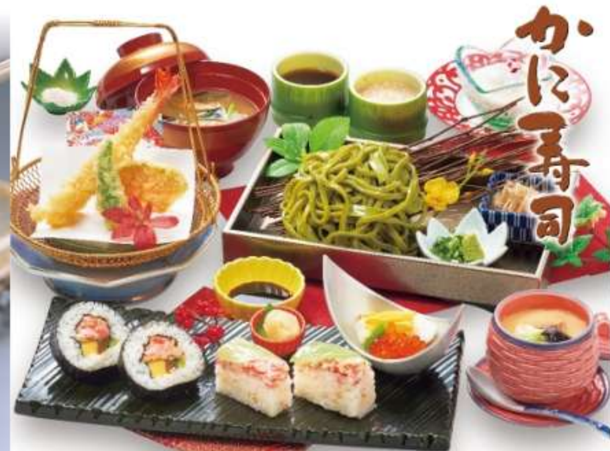
かに寿司御膳 2,000円(税込2,200円)

写真は全てイメージです。 ※季節によって内容が変更になる場合がございます。詳しくはスタッフにお問い合わせください。