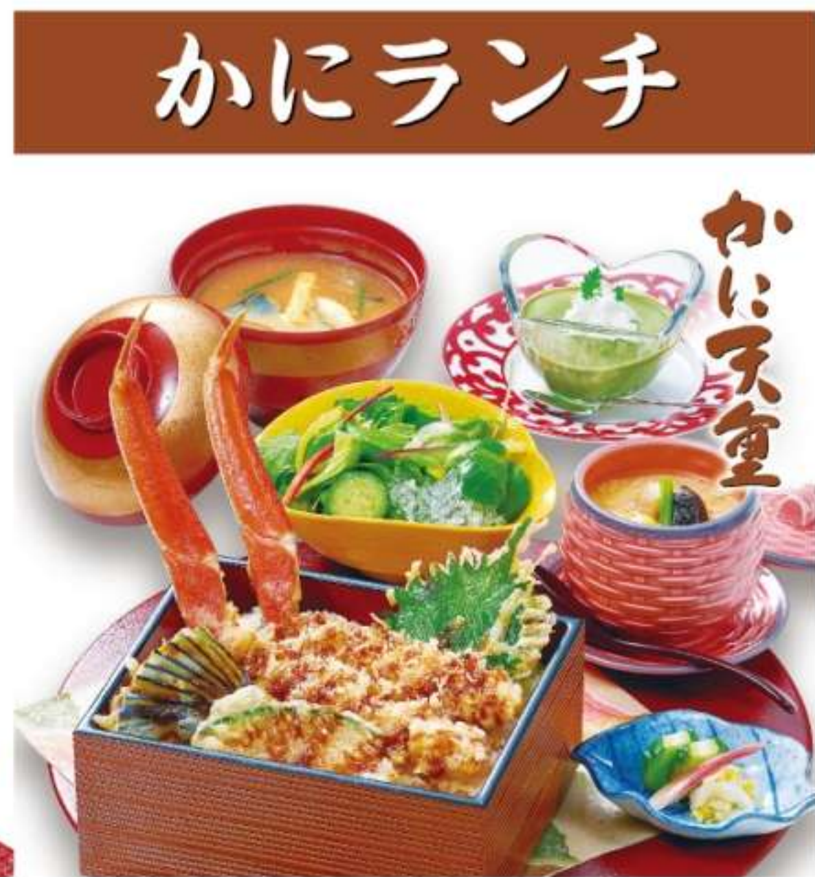
かに天重御膳 上 (かに1本・海老1本) 2,000円(税込2,200円) 特上 (かに2本) 2,300円(税込2,530円)

〈増量〉三種しゃぶ身 1,200円(税込1,320円) ※ご注文時にお申し付けください。