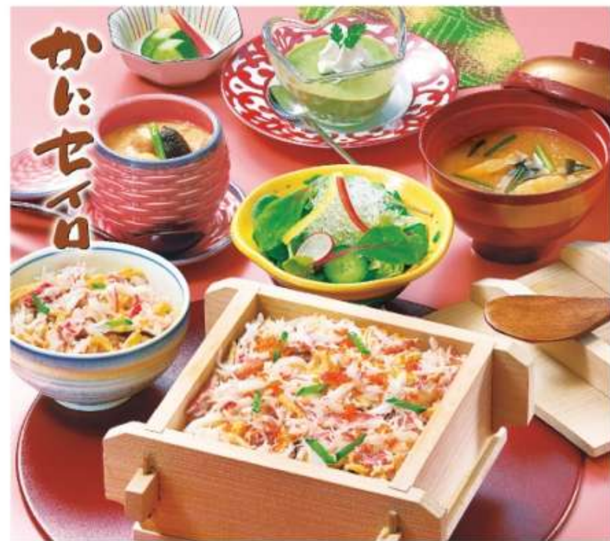
かにセイロ御膳 2,000円(税込2,200円)